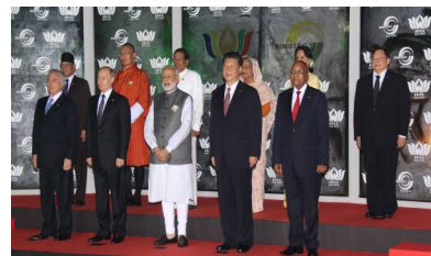
Саммит БРИКС-БИМСТЕК в формате «аутрич»