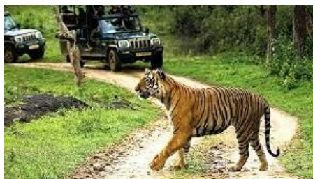
Заповедник тигров Кали