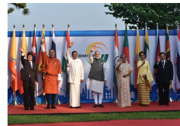
Встреча с лидерами стран БИМСТЕК

Лидеры БИМСТЕК приняли Итоговый документ, выразив благодарность за возможность проведения саммита между лидерами стран БРИКС и БИМСТЕК для обсуждения вопросов, представляющих взаимный интерес, и обмена мнениями по актуальным глобальным и региональным вопросам, включая Повестку дня ООН в области устойчивого развития до 2030 г.